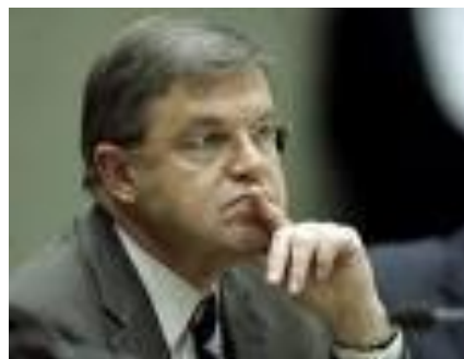
Dr. E.M.H. Ernst Hirsh Ballin

ondernemerschap zouden serieus moeten worden onderbouwd.